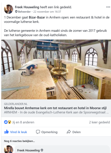
Facebookpagina Luthers in NL

De synode levert indien nodig informatie aan voor Woord en Weg , Petrus en voor uitgaven van de PThU. Daarnaast is op de website Luthers Info ( http://www.luthersinfo.nl/ ) informatie samengebracht over diverse lutherse commissies, initiatieven en bijeenkomsten. De Facebook-pagina Luthers in NL ( https://www.facebook.com/groups/luthersinnl/ ) deelt allerlei initiatieven van lutherse gemeenten of informatie die voor lutheranen van belang is. De synode onderhoudt contact met de beheerder hiervan.