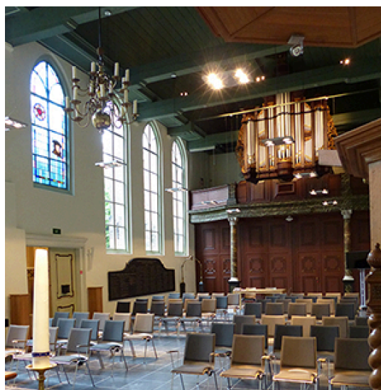
Interieur Evangelisch-Lutherse Kerk Breda

Al in 2003-2004 waren er gesprekken over samengaan met de Protestantse Gemeente Breda, maar die mislukten. En gedurende enkele jaren was er voldoende menskracht om als ELG Breda zelfstandig te blijven. Dat veranderde vanaf 2009-2010 toen een heel aantal jonge gezinnen om meerdere redenen uit Breda vertrok en de gemeente kleiner was geworden. Opnieuw kwam een samenvoeging met de Protestantse Gemeente te Breda in zicht. Nu ging de gemeente anders te werk.