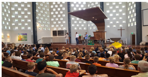
Afsluiting Plek onder de zon 2019 in de Kruiskerk in Amstelveen